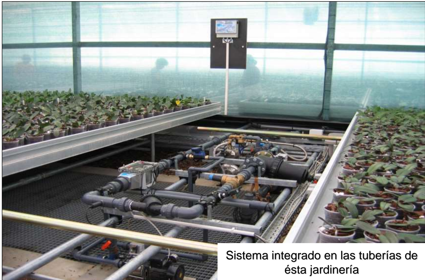
Sistema integrado en las tuberías de ésta jardinería